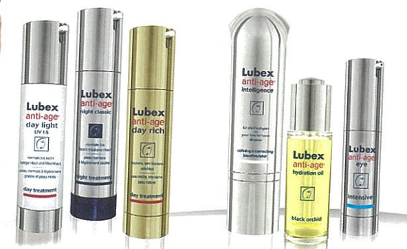
Trattamento diurno e notturno