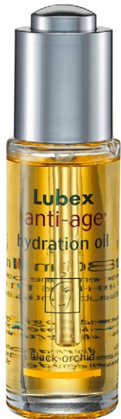
Mit Orchidee Anti-Age Hydration Oil Black Orchid von Lubex mit Orchideenextrakt beruhigt. 30 ml CHF 44.50