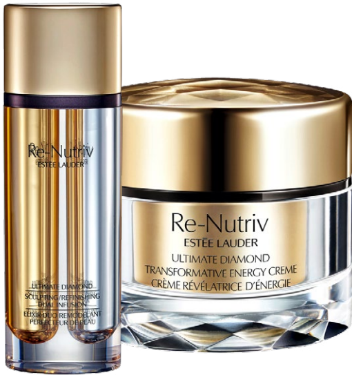
Mit Perigord-Trüffel Estée Lauder Re-Nutriv Ultimate Diamond Dual Infusion Treatment 2 x 12,5 ml für CHF 440.–, und die perfekte Ergänzung Ultimate Diamond Transformative Energy Cream, 50ml CHF 440.–