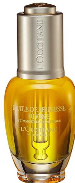
Mit Immortelle-Extrakt Huile de Jeunesse Divine von L'Occitane nährt mit ätherischen Ölen. 30 ml CHF 119.–