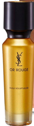
Mit Safran Or Rouge Huile Voluptueuse von Yves Saint Laurent regeneriert und stimuliert die Haut. 30 ml ca. CHF 296.–