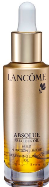
Mit Rosenöl Absolue Precious Oil von Lancôme ist ein Primer-Elixier, das den Zellzusammenhalt stärkt. 30 ml ca. CHF 273.–