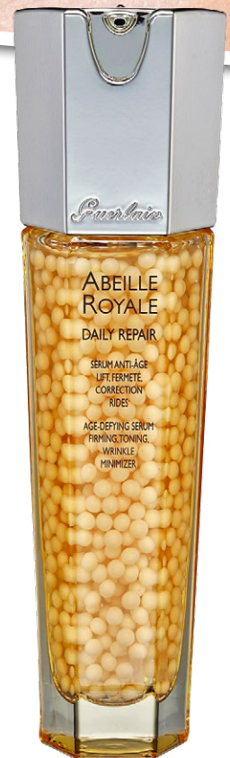
Mit Geleé Royale Daily Repair Serum Abeille Royale von Guérlain repariert Hautschäden. CHF 190.–