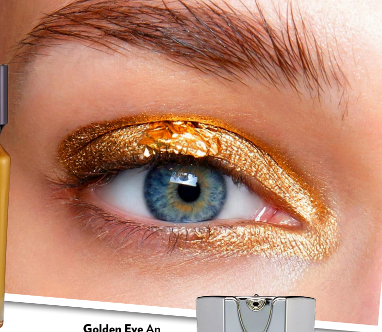
Golden Eye An der Show von Barbara Bui liefern die Models mit Goldlidschatten über den Laufsteg.