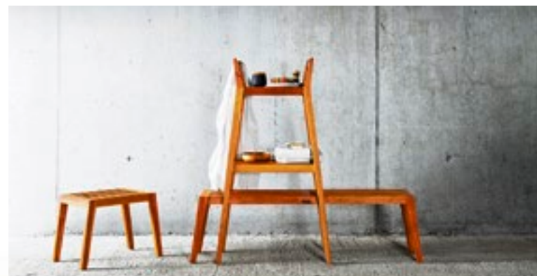
«Aqua & Sapone» heisst die Bademöbellinie von Pibiri & Reich.