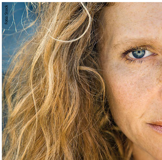
Les premières rides du visage – "sympathiques" disent les uns, "disgracieuses" disent les autres.

La vitamine C (acide ascorbique) est également un puissant antioxydant. L'organisme est incapable de la synthétiser et doit donc la puiser dans l'alimentation. La vitamine C stimule la synthèse du